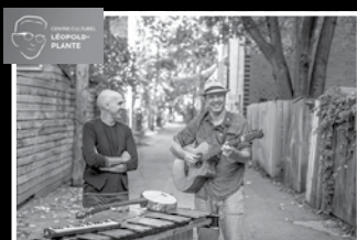
SUSSEX 19 juillet 2018 – 20 h Général 25 $ | Étudiant 20 $