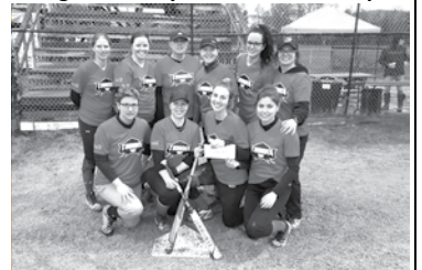
Finaliste – Thunder/Petro-Canada du Témiscouata

Félicitations aux équipes et merci pour votre présence!