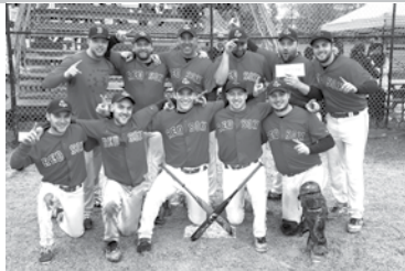
Gagnant A – Red Sox de Squatec