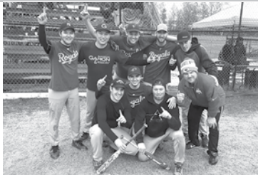
Gagnant B – Royals de Squatec