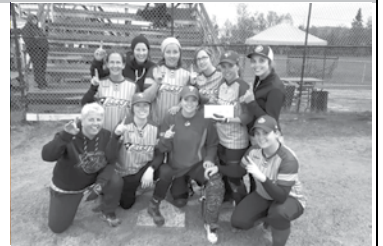
Gagnante – Jays de Rivière-du-Loup