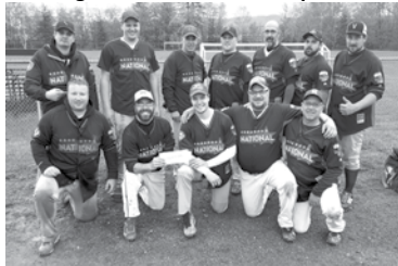
Finaliste A – Nations-Unies de Québec