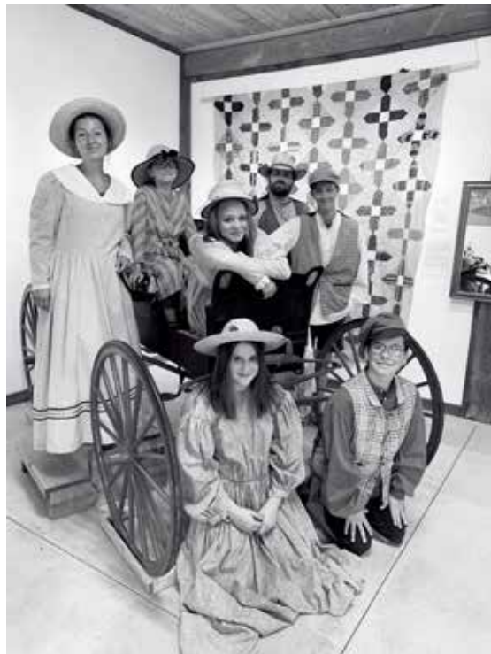
Souvenir de voyage au village historique de King's Landing de Fredericton

Cet été, nos jeunes ont fait quelques sorties : premièrement, une sortie au Miller Zoo en compagnie des 5 autres MDJ du Témiscouata, visite à l'Expo agricole de Rimouski, au Parc aquatique de Valcartier, et en compagnie du travailleur de rue, visite du village historique de King's Landing à Fredericton.