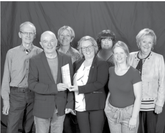
Entreprise culturelle de l'année 2019

Notre organisme a reçu la distinction « Entreprise culturelle de l'année 2019 » lors du Gala de l'entreprise du Témiscouata tenu le 19 octobre dernier. Nous tenons à partager cette reconnaissance avec tous ceux et celles qui collaborent à la réussite et au succès de l'événement, entre autre, avec les dévoués bénévoles qui appuient le conseil d'administration et qui s'impliquent dans la réalisation de l'événement.