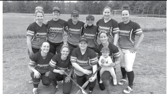
Finaliste – Distributions Roussel de Rimouski