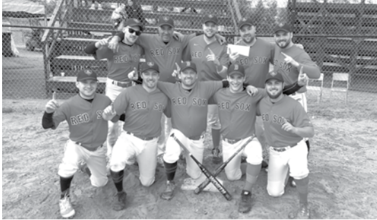
Équipe championne A – Red Sox de Squatec