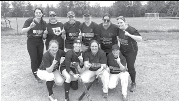
Équipe championne – Club piscine de Québec