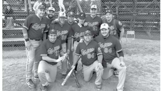
Finaliste A – Expos conception navale FMP de Pabos-Mills