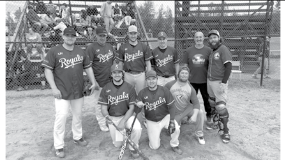
Finaliste B – Royals de Squatec