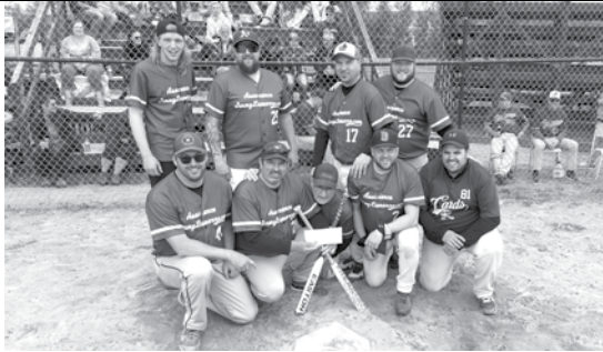
Équipe championne B – Ligue de balle-molle de Rimouski